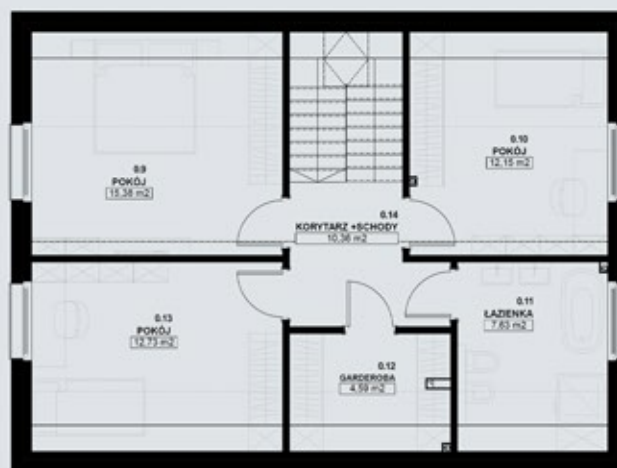
TYP PIĘTROWY 130-C - PODDASZE