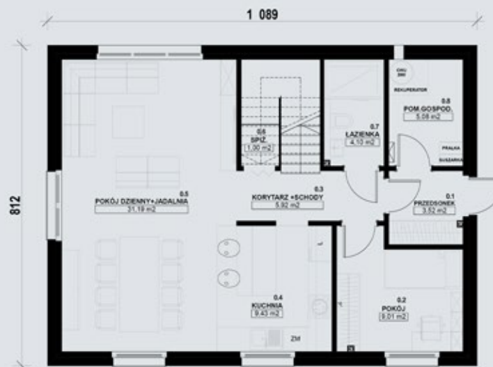
TYP PIĘTROWY 130-C - PARTER