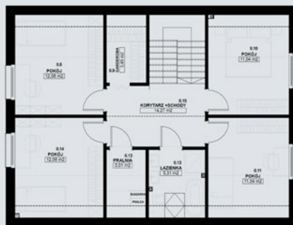
TYP PIĘTROWY 150-B - PODDASZE