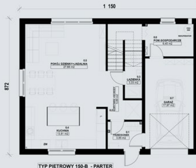
TYP PIĘTROWY 150-B - PARTER