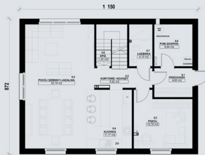
TYP PIĘTROWY 150-A - PARTER