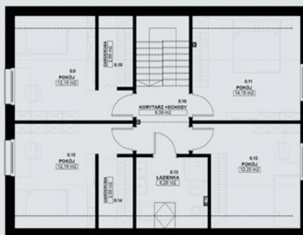
TYP PIĘTROWY 150-A - PODDASZE